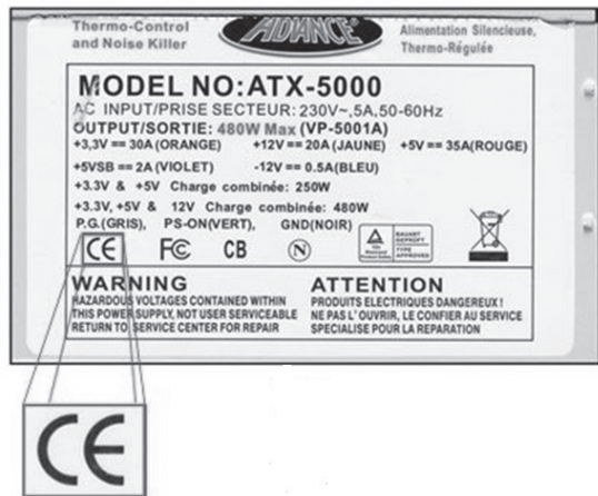
Slika 4: Primer ponarejene oznake CE na izdelku [4]

čiti proizvajalcu ali trgovcu, pri katerem je bil proizvod kupljen. Hkrati je treba obvestiti javni organ, s čimer se zagotovi nadaljnje ukrepanje za zagotavljanje varnosti proizvoda.