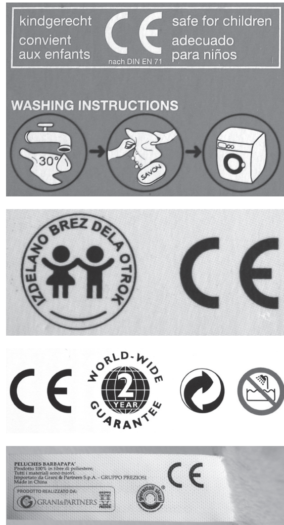
Slika 2: Primeri pravilnega označevanja izdelkov

Namestiti se mora na proizvod, etiketo ali embalažo proizvoda. Mora biti vidna, neizbrisna in čitljiva (slika 2).